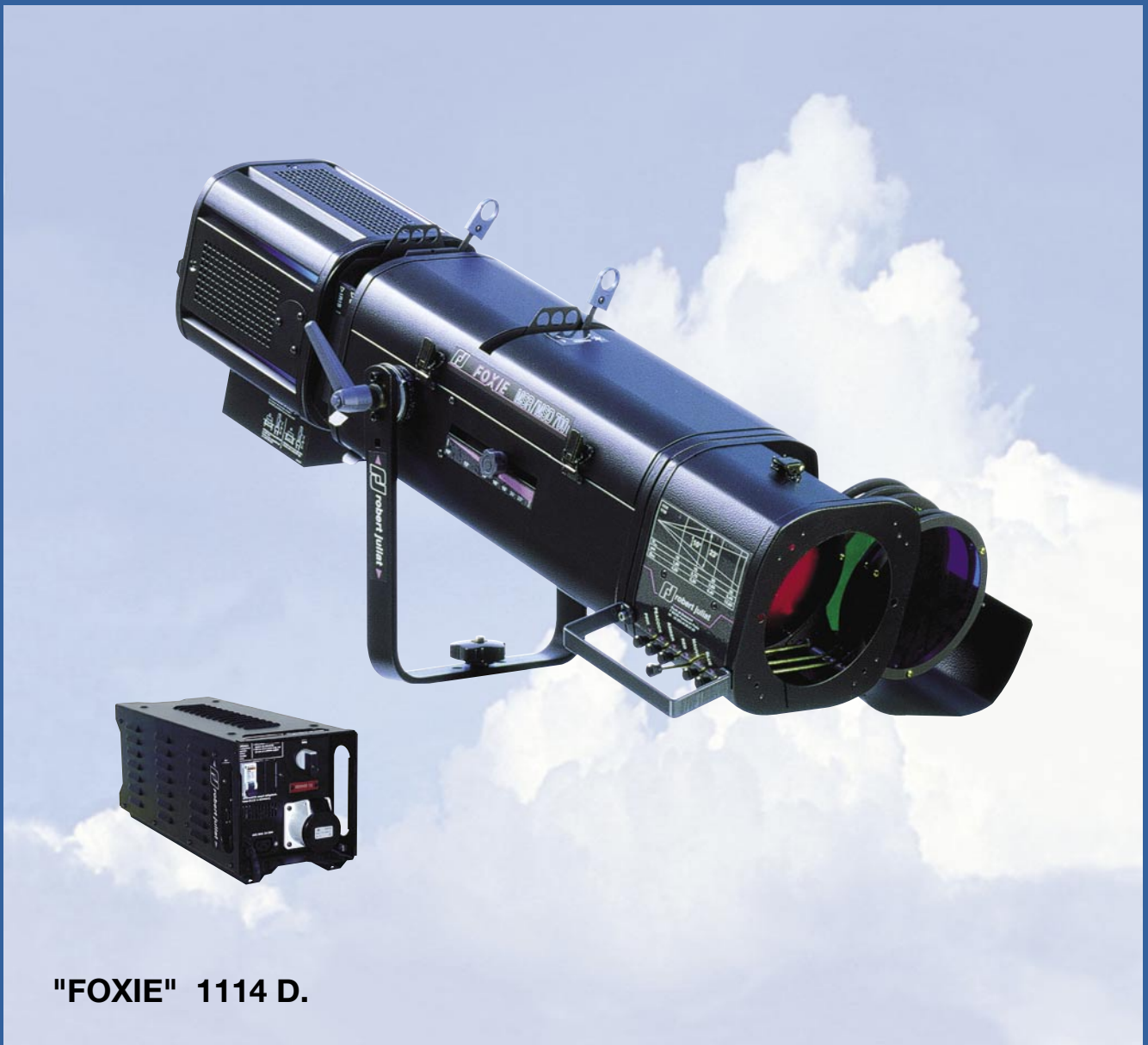
"FOXIE" 1114 D.

POURSUITE MSR/MSD 700W. 700W MSR/MSD FOLLOW SPOT. ZOOM 11,5° / 22°.